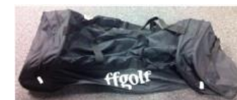
120 balles (dans 2 sacs)