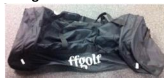
1 sac de 60 balles mousse couleurs