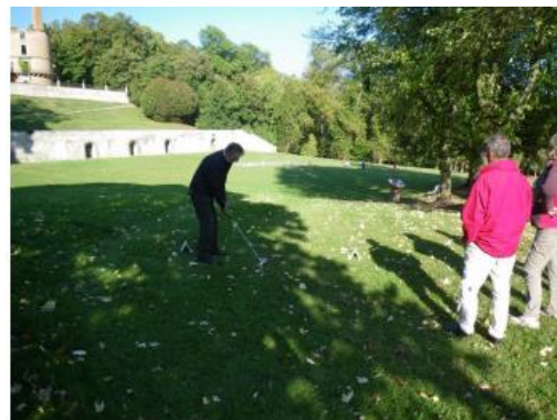
Pour jouer au golf, n'importe quel espace vert public fera l'affaire. c'est facile, simple, rapide et GOLFIQUE!