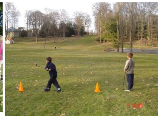
Installer un parcours avec un départ et une cible pour chaque étape c'est facile, simple, rapide et GOLFIQUE!