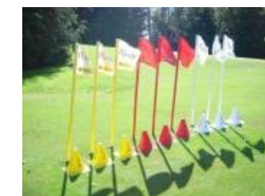
9 fanions 18 cônes